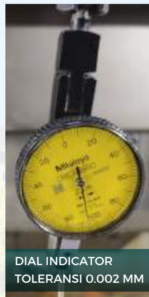
DIAL INDICATOR TOLERANSI 0.002 MM