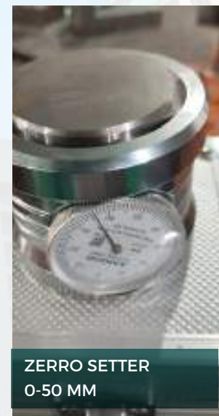
ZERRO SETTER 0-50 MM