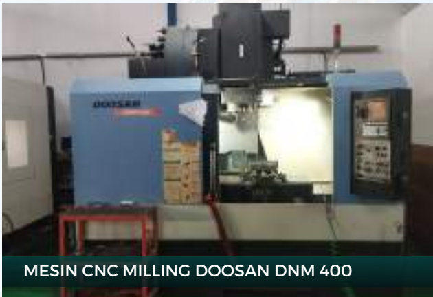
MESIN CNC MILLING DOOSAN DNM 400