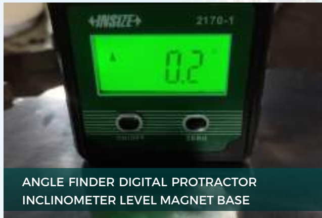
ANGLE FINDER DIGITAL PROTRACTOR INCLINOMETER LEVEL MAGNET BASE