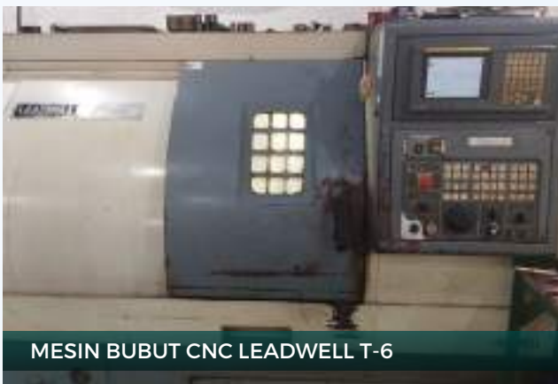
MESIN BUBUT CNC LEADWELL T-6

Sebagai perusahaan yang berfokus pada keunggulan dalam Engineering & Manufacturing, PT Adinata Mandiri Perkasa tidak hanya menyediakan layanan utama yang berkualitas, tetapi juga dilengkapi dengan berbagai layanan pendukung atau utility untuk memastikan operasional yang optimal dan kepuasan pelanggan.