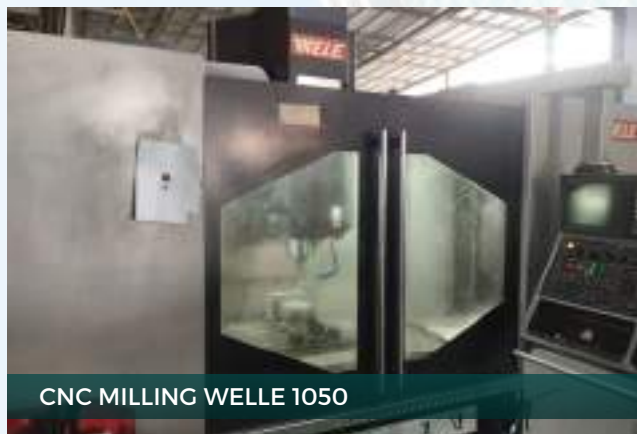
CNC MILLING WELLE 1050