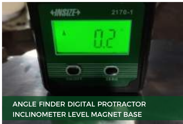
ANGLE FINDER DIGITAL PROTRACTOR INCLINOMETER LEVEL MAGNET BASE