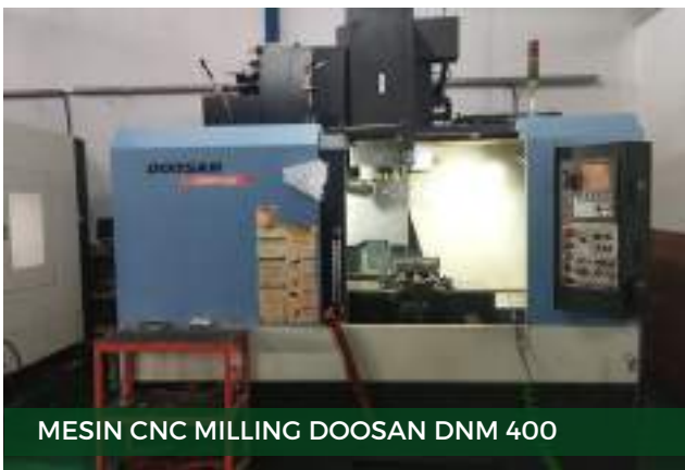
MESIN CNC MILLING DOOSAN DNM 400