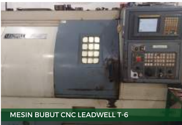
MESIN BUBUT CNC LEADWELL T-6