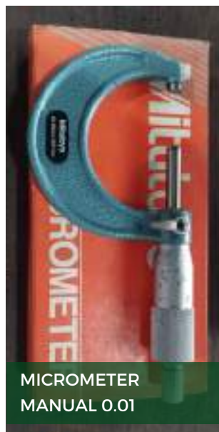
MICROMETER MANUAL 0.01