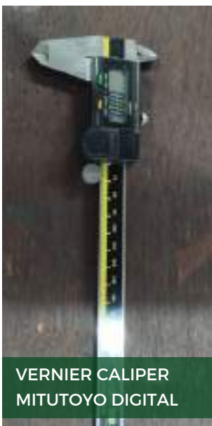
VERNIER CALIPER MITUTOYO DIGITAL