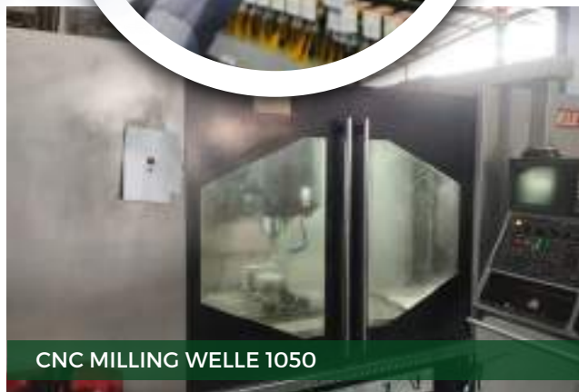
CNC MILLING WELLE 1050