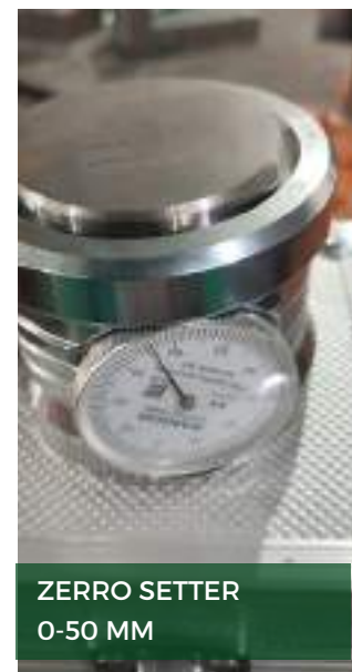
ZERRO SETTER 0-50 MM