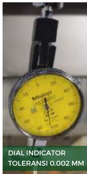
DIAL INDICATOR TOLERANSI 0.002 MM